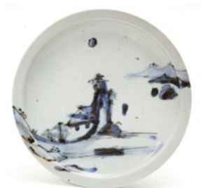
Teller mit Landschaftsmalerei in Unterglasurkobaltblau, Porzellan, Arita, Japan, 1625-1650

Begrenzte Teilnehmendenzahl. Verbindliche Anmeldungen zu Führungen und Workshops unter T 0211 89 94 201